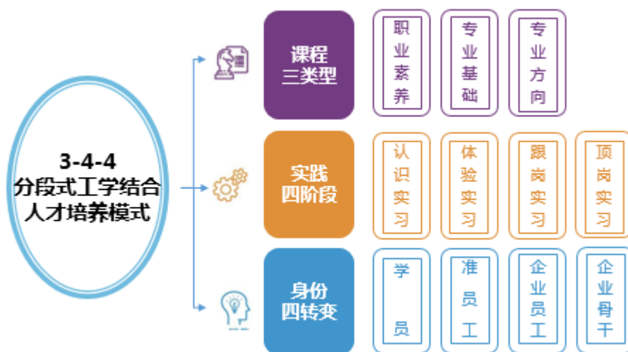
图1 “3-4-4”分段式工学结合的人才培养模式