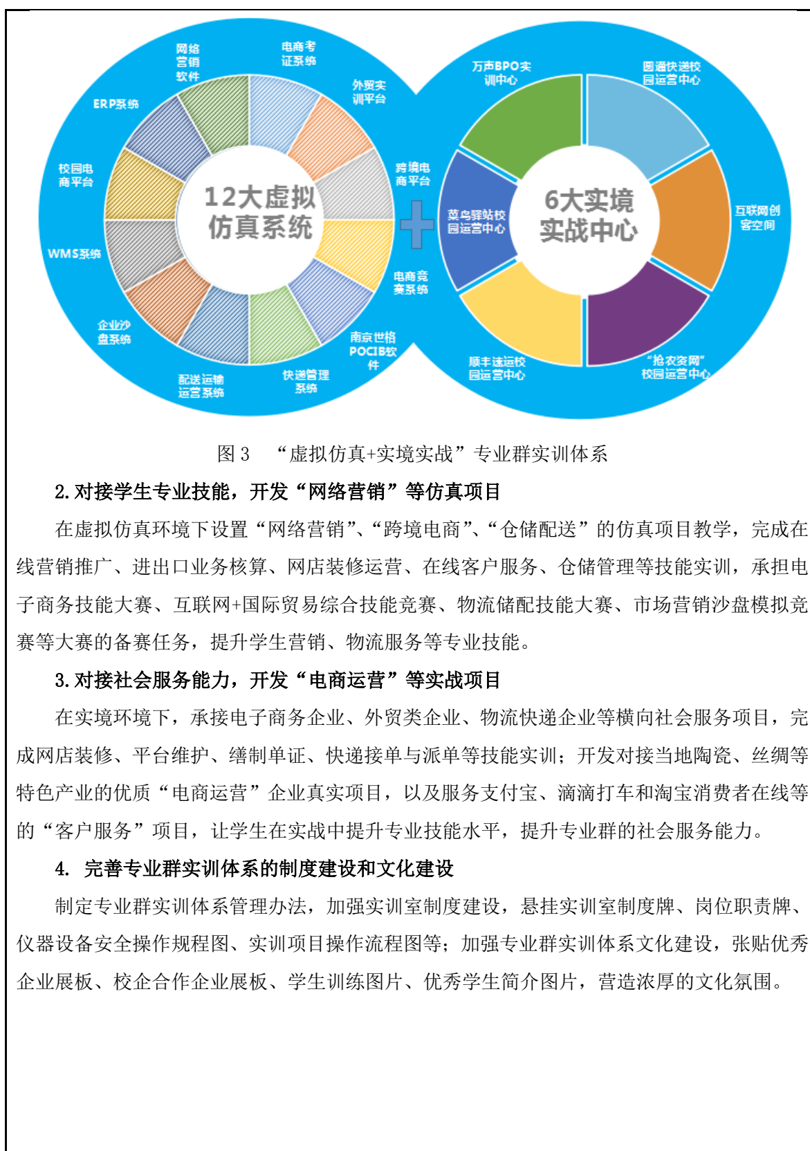
图3 “虚拟仿真+实境实战”专业群实训体系